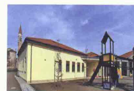
Scuola dell'Infanzia S. Giuseppe

Il corpo di fabbrica più grande, la scuola vera e propria, è quindi costituito da un atrio centrale