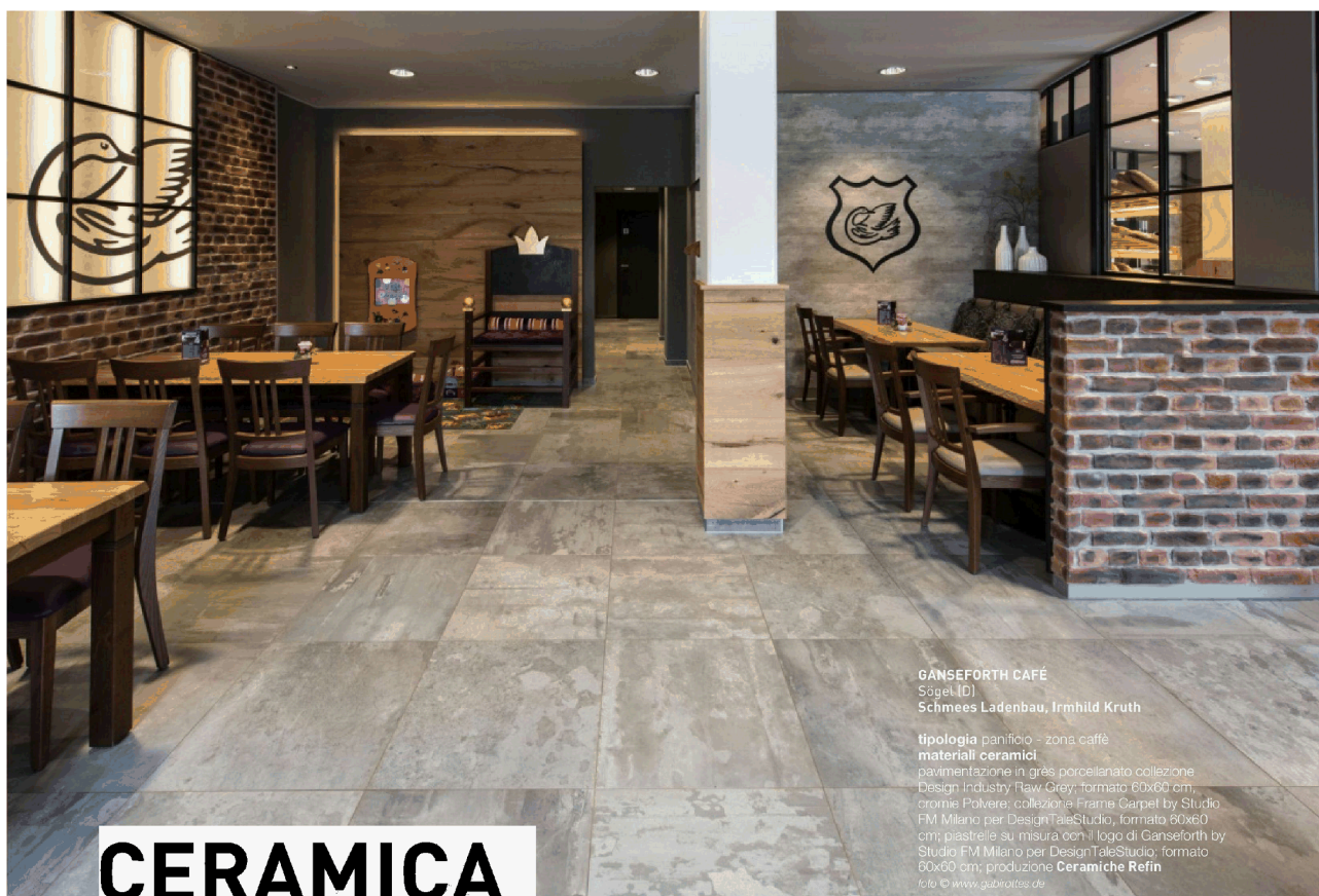
GANSEFORTH CAFÉ Sögel (D) Schmees Ladenbau, Irmhild Kruth

tipologia panificio - zona caffè materiali ceramici pavimentazione in grés porcellanato collezione Design Industry 'Raw Grey', formato 60x60 cm; cromie Polvere; collezione Frame Carpet by Studio FM Milano per DesignTaleStudio, formato 80x60 cm; piastrelle su misura con il logo di Ganseforth by Studio FM Milano per DesignTaleStudio; formato 60x60 cm; produzione Ceramiche Refin